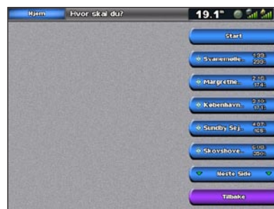
Liste over maritime tjenester