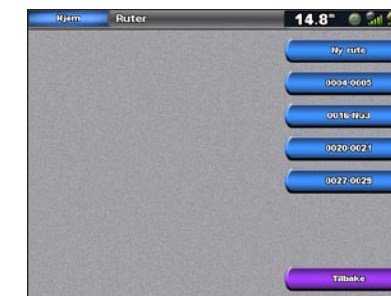
Skjernbilde for ruter