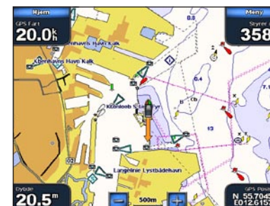
Mann over bord