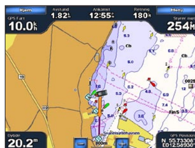
Kjøre til bestemmelsesstedet

Slik merker du gjeldende posisjon som et veipunkt: