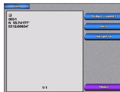
Skjermbildet Opprett veipunkt