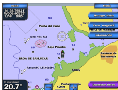
Carta de navegación