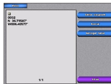
Crear una pantalla de waypoint