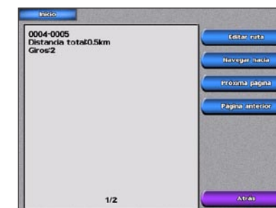
Información de la ruta