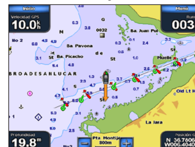
Hombre al agua

Desde la pantalla Inicio, toque Marcar > Hombre al agua .