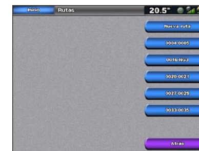
Pantalla de rutas