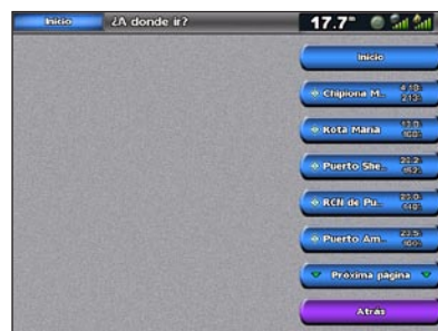
Lista de elementos del servicio marítimo