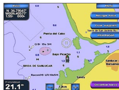
Carta de navegación