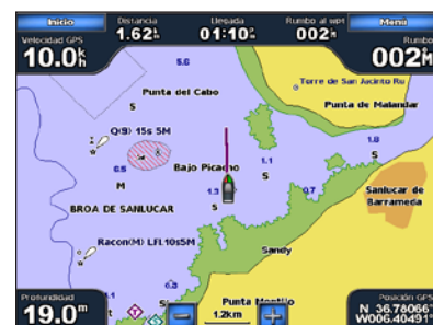
Siga la ruta