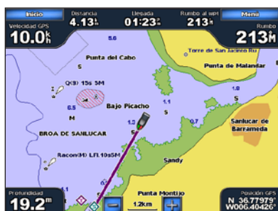
Ir a destino