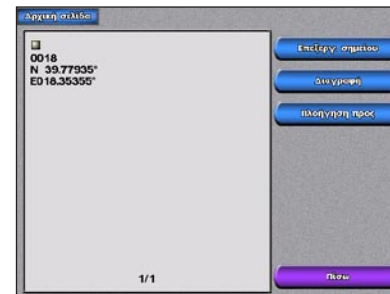
Οθόνη δημιουργίας σημείου