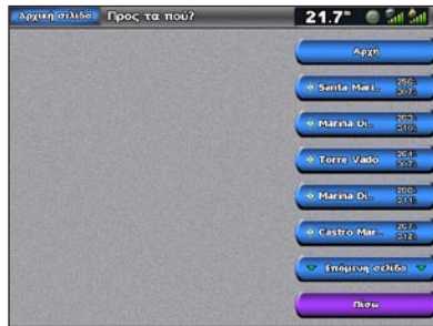
Λίστα στοιχείων ναυτικής υπηρεσίας