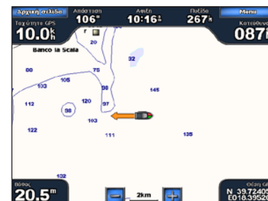
Άνθρωπος στη θάλασσα

Από την αρχική οθόνη, αγγίξτε την επιλογή Μαρκάρισμα > Άνθρωπος στη θάλασσα .