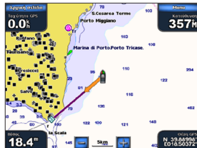
Μετάβαση σε προορισμό