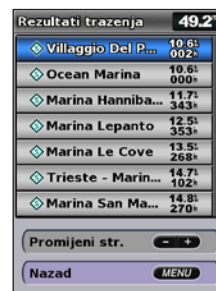
Pregled rezultata pretraživanja