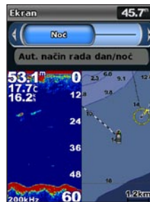
Noćni način rada