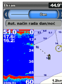
Dnevni način rada