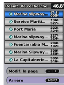
Affichage des résultats de la recherche