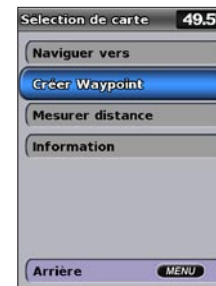
Création de waypoint