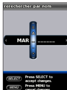
Saisie du nom

Pour naviguer vers la position, sélectionnez la position > Naviguer vers > Rallier .